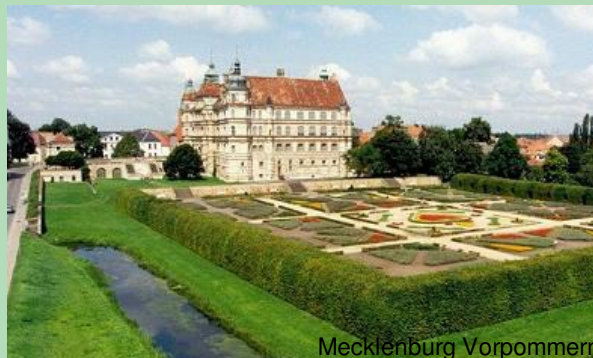
Schloss in MV

Durch den Landkreis Güstrow verläuft die Autobahn 19 von Rostock in Richtung Berlin sowie die Bundesstraßen 103 und 104. Ca. 20 km nördlich von Güstrow liegt der Flughafen Rostock-Laage . Von dort aus starten Linienflüge nach München, Köln und Nürnberg sowie Charterflüge (Spanien/Balearen, Marokko, Türkei, Ägypten u. a.)